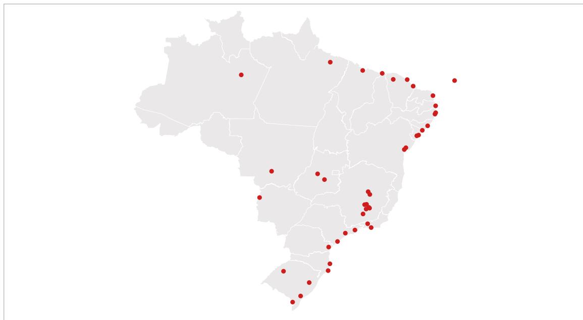
Figura 1. Mapa do Brasil com a localização das cidades contempladas pelo PAC-CH/2013 (Dados retirados e adaptados do Instituto do Patrimônio Histórico e Artístico Nacional [IPHAN], 2013b).

Mapa de Brasil con la ubicación de las ciudades cubiertas por el PAC-CH/2013 (Datos extraídos y adaptados del Instituto del Patrimonio Histórico y Artístico Nacional de Brasil [IPHAN], 2013b).